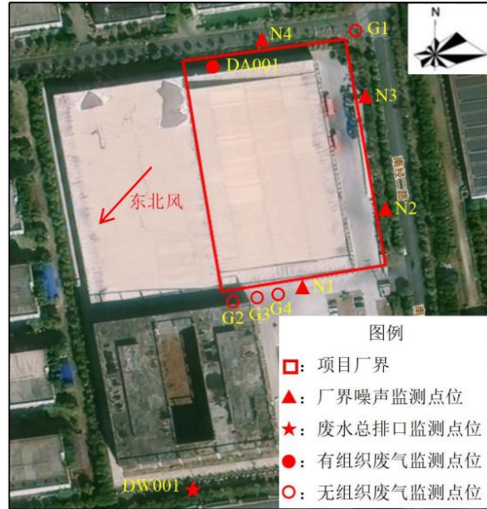
附图 6-1 项目监测布点图（2026 年 4 月 16 日、18 日）

芜湖普威技研有限公司弋江分公司年产 100 万套汽车零部件项目阶段性竣工环境保护验收监测于 2026 年 4 月 16 日-18 日、4 月 20 日、4 月 24 日进行验收监测。根据有关规定，为保证监测结果能正确反映企业正常生产时污染物实际排放状况，监测期间的生产负荷满足环保验收监测对生产工况的要求，各项污染治理设施运行正常，工况基本稳定。监测布点图详见下图。