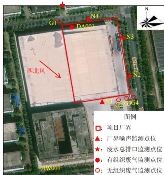
附图 6-2 项目监测布点图（2026 年 4 月 17 日、24 日）